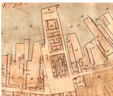
Karta från 1815-16.