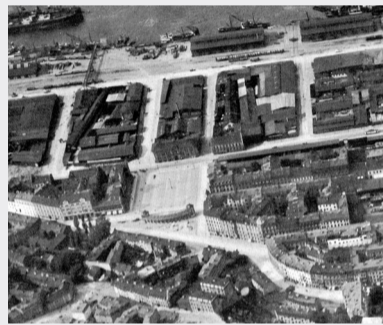
Flygfoto över Masthuggstorget, kring år 1920.

TILL HÖGER: Strömmanska huset. Precis bakom byggnaden ligger de förrådsbyggnader där Kommersen är idag.