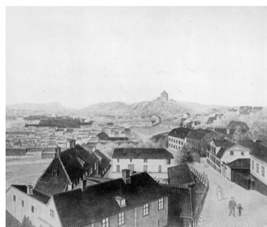
Akvarell över Masthugget, sett från Stigbergsliden 1860.

Under slutet av 1800-talet omdanades Masthugget med utgångspunkt från 1866 års utbyggnads- och regleringsplan. Masthuggstorget