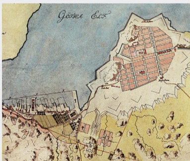
Göteborg och förstaden Masthugget år 1777.