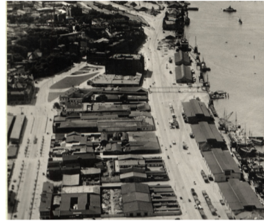
Masthuggshamnen, sedd från ovan, förmodligen 1930-tal. Intill kajkanten syns tull- och packhus.

TILL HÖGER: Nuvarande Kommersenbyggnaden tidigt 1950-tal.